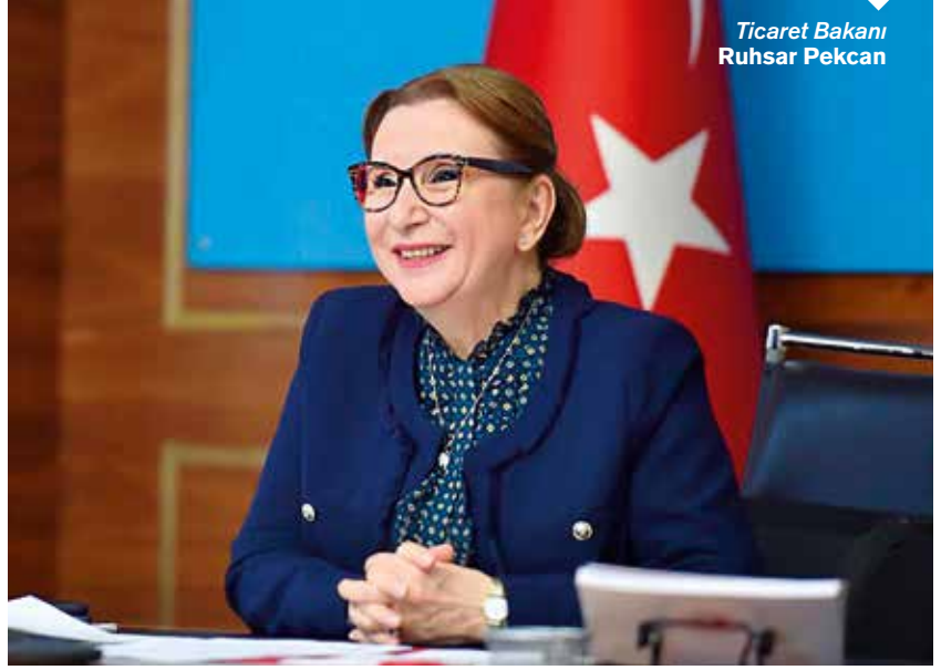
Ticaret Bakanı Ruhsar Pekcan