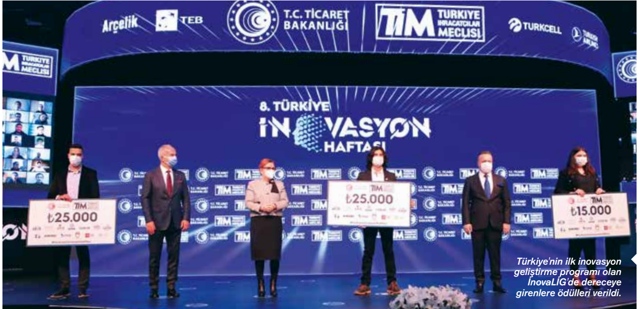
Türkiye'nin ilk inovasyon geliştirme programı olan InovaLIG'de dereceye girenlere ödülleri verildi.

kişiselleştirme fikri. Instagram'da biz herkes için temelde aynı olan bir ürünü alıp, onu herkese özel hale getirebildik. Bu trendler diğer yerlerde de gerçekleşiyor. Haberleri nasıl aldığımız, ilaçları nasıl temin ettiğimiz, tüm bu farklı alanlar verinin gücünü birleştirebileceğimiz kişiye özel alanlardır. Bu, insan bilgisayar etkileşimi temel fikrine dayanır. Bilgisayar ve yazılımları her birey için nasıl daha kullanılır hale getirebiliriz. İkincisi ise yazılım ve donanımı yazılım dünyasında tamamen farklı iki ayrı alan olarak görmek yerine, ikisinin keşimi konusunda heyecanlıyım. Daha önce de belirttiğim gibi yazılım, sağlık ve tıpta yeni inovasyonlar yaratmak için kullanılabilir.”