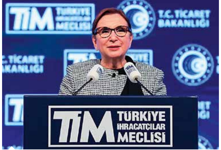
Ticaret Bakanı Ruhsar Pekcan imalat sanayi ihracatı içinde teknolojik ürünlerin payının yüzde 39,5 düzeyinde olduğuna dikkat çekti.

8. Türkiye İnovasyon Haftası'nın açılışına ve İnoVALİG Ödül Töreni'ne katılan Ticaret Bakanı Ruhsar Pekcan ise Türkiye'nin bilgi üreten ve ihraç eden ülke olma noktasında kapasitesini her geçen gün güçlendirdiğini vurguladı. İnovasyonun üretimde olduğu kadar iş geliştirmede, pazarlamada, müşteri ilişkilerinde, dış ticaret operasyonlarında ve lojistikte, ekonomik aktivitenin tüm boyutlarında geçerli bir olgu olduğunu ifade eden Pekcan, tüm sektörler ve tüm ekonomik faaliyetlerde inovatif düşüncüyü, inovatif yöntemleri ve inovatif uygulamaları hayata geçirmenin yollarının aranması gerektiğini bildirdi. İmalat sanayi ihracatı içinde teknolojik ürünlerin payına ilişkin bilgi veren Bakan Pekcan, "2020 yılı ilk 11 ay itibarıyla, teknoloji sınıflandırması bakımından, imalat sanayi ihracatımız içinde en yüksek payı yüzde