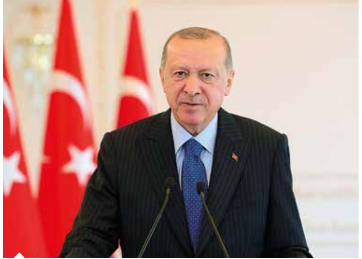
Cumhurbaşkanı Erdoğan, Türkiye İnovasyon Haftası programı kapsamında İnovaLİG ödüllerini kazanan kişileri, kuruluşları ve firmaları kutladı.

T ürkiye İhracatçılar Meclisi'nin (TİM) inovasyon kültürünün gelişimine katkı sağlamak için Ticaret Bakanlığı koordinasyonuyla 8'incisini düzenlediği Türkiye İnovasyon Haftası'nda ilham verici konuşmalar ve örnek başarı hikâyeleri milyonlarca takipçiye yeni ufuklar açtı. Pandemi nedeniyle bu yıl online gerçekleştirilen Türkiye İnovasyon Haftası, fikir liderlerinin deneyimlerini, inovasyonun farklı yönlerinin alanında uzman kişiler tarafından enine boyuna konuşulduğu panelleri, inovatif gelişmeleri, girişimcileri, inovasyon odaklı projeleri, fark yaratan uluslararası profesyonelleri, Türkiye'nin önde gelen şirketlerinin yöneticilerini, kamunun en üst düzey temsilcileri de dâhil inovasyona dokunan tüm paydaşları bir araya getirdi. Cumhurbaşkanı Recep Tayyip Erdoğan ile beraber Ticaret Bakanı Ruhsar Pekcan, Millî Savunma Bakanı Hulusi