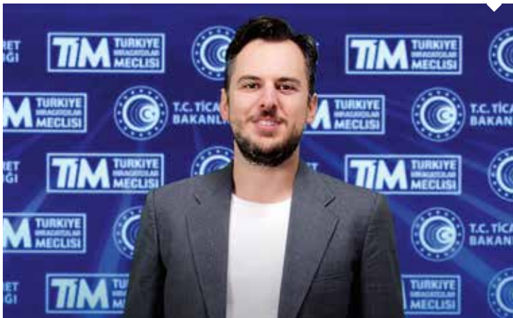
Instagram Kurucu Ortağı Mike Krieger, Covid-19'un birçok şirketin çalışma şekillerini yeniden düşünmeye zorladığını belirtti.

Kendisini heyecanlandıran teknoloji alanlarını da paylaşan Krieger, "İlki yapay öğrenme ve kişiselleştirme. Yapay öğrenmenin teknolojinin heyecan verici yeni bir alanı olduğu sır değil. İçerisindeki alanlardan beni özellikle heyecanlandıranı