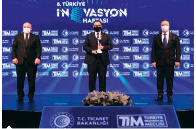
Sanayi ve Teknoloji Bakanı Mustafa Varank, TİM Başkanı İsmail Gülle ile birlikte İnovaLİG ödüllerini takdim etti.