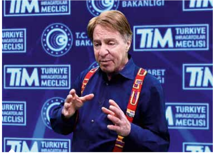
Fütürist ve mucit Ray Kurzweil, "Sadece zekâmızı geliştirerek dünyanın en büyük zorluklarını çözebileceğiz" dedi.

düşünüyorum. Yakında tüm ürün ve hizmetlerin değerinin yüzde 100'ü yazılım ve ilgili bilgi biçimlerinden oluşacak.”