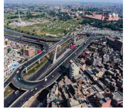
Pakistan'da potansiyel yatırım alanları telekomünikasyon, limanlar, havalimanları, demiryolları, tekstil, tarıma dayalı sanayi ve enerji üretimi olarak sıralamıyor.

bulunuyor. Ülkenin ana tedarikçilerinin başında 12,4 milyar dolar hacim ve yüzde 24,8'lik pay ile Çin geliyor. Pakistan, Birleşik Arap Emirlikleri'nden 6,34 milyar dolarlık, ABD'den 2,61 milyar dolarlık, Suudi Arabistan'dan 2,43 milyar dolarlık, Endonezya'dan 2,22 milyar dolarlık ithalat gerçekleştiriyor.