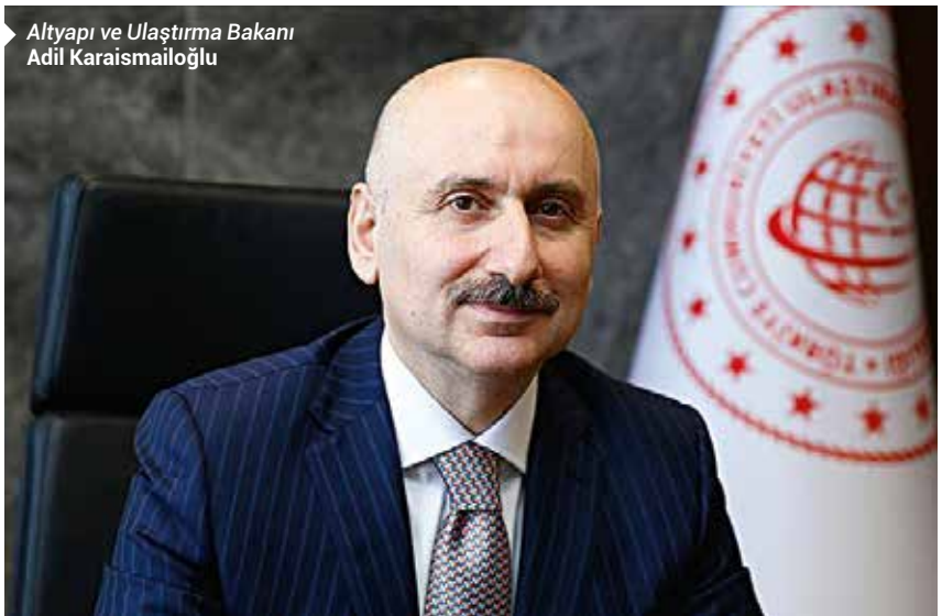
Altyapı ve Ulaştırma Bakanı Adil Karaismailoğlu

Demir yolunda yük konusundaki çalışmaların yanı sıra, hızlı tren çalışmalarının da devam ettiğini belirten Karaismailoğlu, "Ankara-İzmir hattımız bir taraftan devam ediyor. Güneyde, Gaziantep'teki